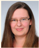
Nadine Rott Geschäftsstelle GRC